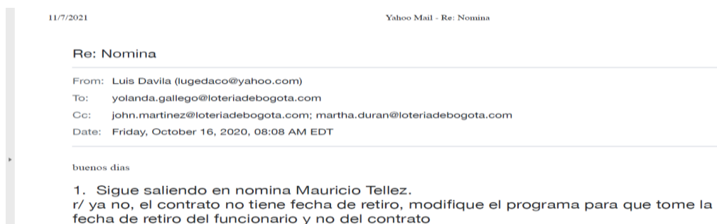
Imagen 7 AJUSTES REALIZADOS EN EL APLICATIVO POR TEMAS - EXFUNCIONARIO

Así mismo, es importante precisar que de acuerdo con las revisiones que realiza la Entidad al Aplicativo, se encontró en los correos remitidos al Organismo de Control, mediante radicado 2-2021-906 del 15/07/2021, ajustes que puedan estar afectando el valor correcto de las cifras, a manera de ilustración se muestran dos pantallazos de los correos.