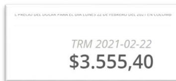
Imagen 2 VALOR DEL DÓLAR EL 22/02/2021