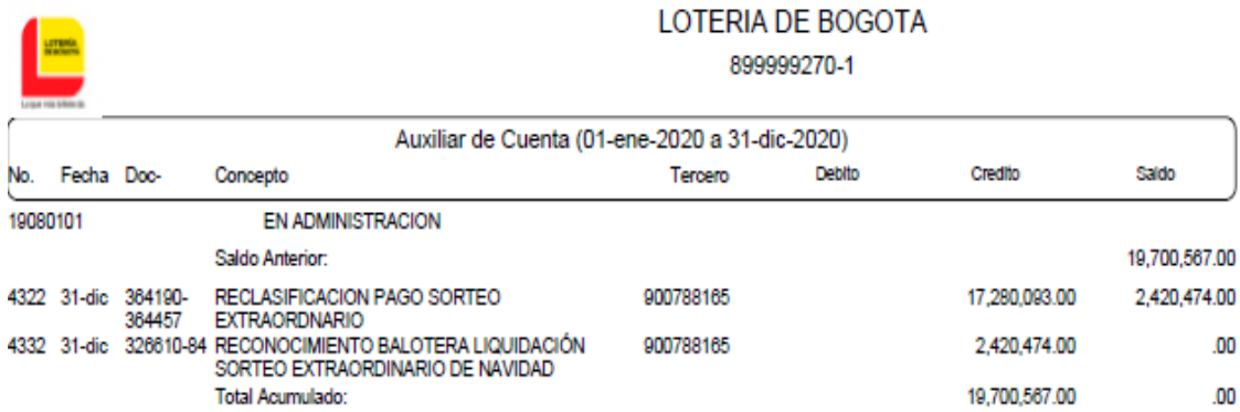
Imagen 8 AUXILIAR CONTABLE CUENTA 19080101 REINTEGRO DE RECURSOS