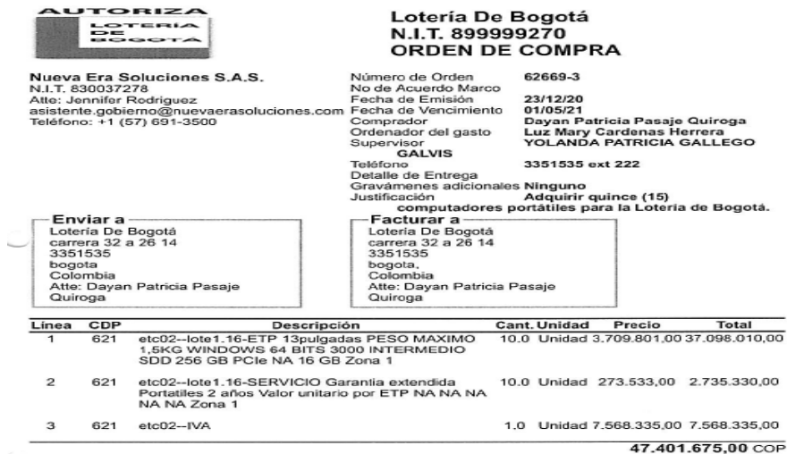
Imagen 5 ORDEN DE COMPRA 15 COMPUTADORES